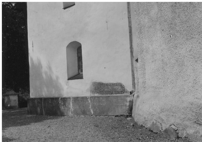
Fig. 14. Ög 11. Vårdsbergs kyrka. Foto Nordén 1941.