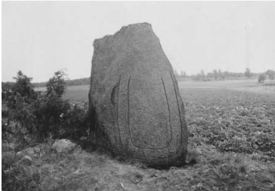
Plansch 68b. Ög 116. Ånväga, Skeda sn. 1945. [Jansson skriver 1947 om planscher 68a och 68b (betecknade 55 1,2): Retuscherad. Dåliga men användbara]

Stenen står rest c:a 175 m. rakt öster om Ånväga mangård och c:a 30 m. söderut från landsvägen Selgsäter – L. Aska. Möjligen står den på en gammal gravhög, varav en tredjedel nu återstår. Det är en rätt fult formad sten, ett klumpigt markblock utan tillhuggning, och möjligen är detta förklaringen till, att ristaren plötsligt avbrutit sitt arbete, sedan större delen av slingan fullbordats: övre delen av denna slinga fattar, och några runor ha aldrig inhuggits på stenen. — I äldre tid gick, enligt nuv. markägarens uppgift, landsvägen närmare runstenen och passerade Tinnerbäcken i ett läge mellan nuv. mangårdsbyggnaden och arrendatorbostaden. Stenen står alltså i samband med en äldre väg, mot vilken den vänt sin framsida, vilket förklarar, att inskriftssidan vetter 35 åt NO.