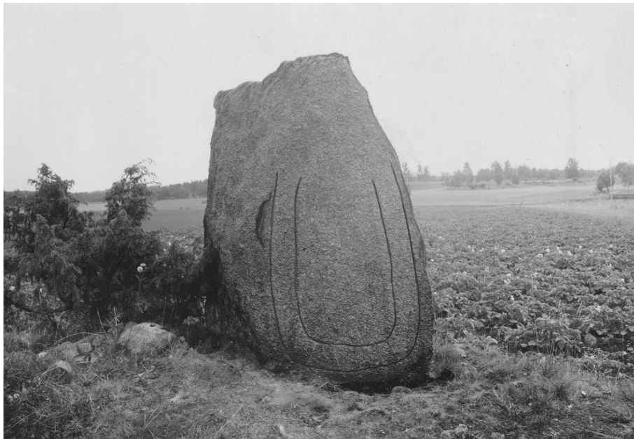
Plansch 68b. Ög 116. Ånväga, Skeda sn. Foto Nordén 1945. [Jansson skriver 1947 om planscher 68a och 68b (betecknade 55 1,2): Retuscherad. Dåliga men användbara]

Stenen står rest c:a 175 m. rakt öster om Ånväga mangård och c:a 30 m. söderut från landsvägen Selgsäter – L. Aska. Möjligen står den på en gammal gravhög, varav en tredjedel nu återstår. Det är en rätt fult formad sten, ett klumpigt markblock utan tillhuggning, och möjligen är detta förklaringen till, att ristaren plötsligt avbrutit sitt arbete, sedan större delen av slingan fullbordats: övre delen av denna slinga fattar, och några runor ha aldrig inhuggits på stenen. — I äldre tid gick, enligt nuv. markägarens uppgift, landsvägen närmare runstenen och passerade Tinnerbäcken i ett läge mellan nuv. mangårdsbyggnaden och arrendatorbostaden. Stenen står alltså i samband med en äldre väg, mot vilken den vänt sin framsida, vilket förklarar, att inskriftssidan vetter 34 åt NO.