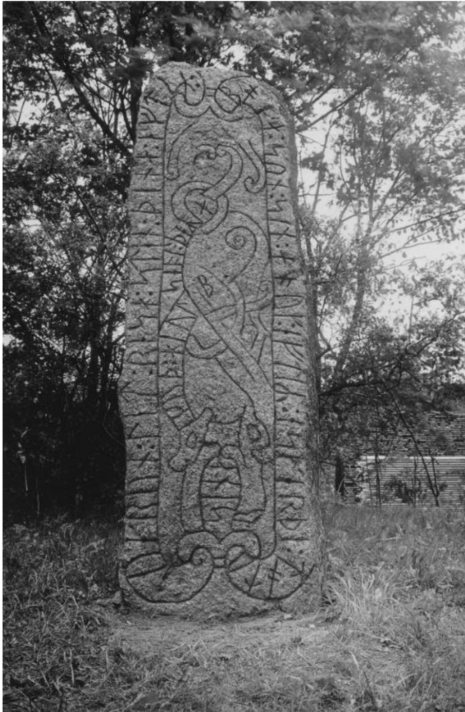
Plansch 67. Ög 113. Nykvarn vid Linköping, S:t Lars sn. Foto Nordén 1945. [Vid planschen står »Hålles ljusare!«. Jansson skriver 1947: Kraftigt retuscherad! Trots detta ej bra till klichering.]