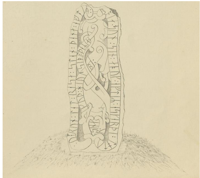
Fig. 127. Ög 113. Nykvarn vid Linköping, S:t Lars sn. Teckning C. F. Nordenskjöld reseberättelse 1874 (ATA).