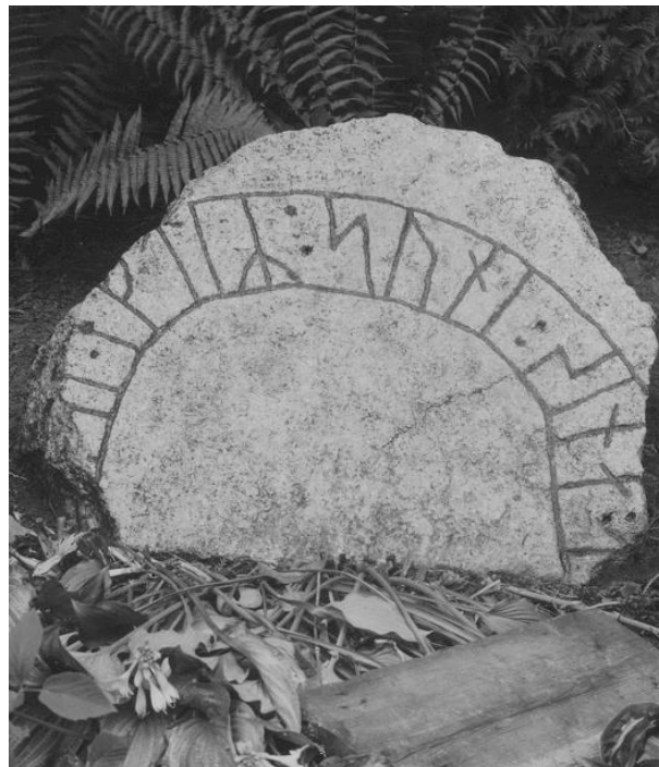
Plansch 66b. Ög 110. Lagerlunda, Kärna sn. Foto Nordén 1945. [Vid planschen står »Frigöres» Jansson skriver 1947: Skiljet. inlagda på kopian. Duger.]