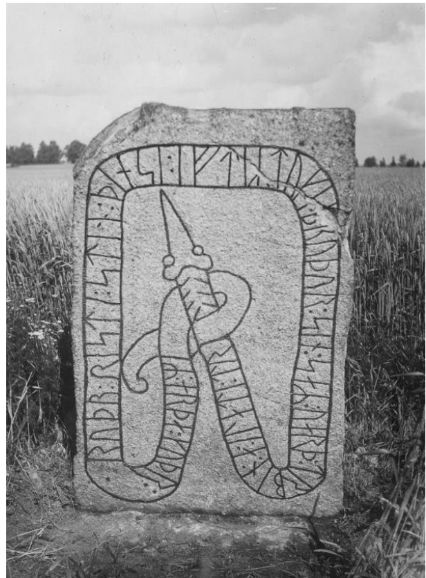
Plansch 64a. Ög 104. Gillberga, Kaga sn. Foto Nordén 1945. [Jansson skriver 1947: Delvis retusch.]

Till läsningen: Till Brates läsning av inskriften är intet annat att tillägga än att jag icke vill instämma i Brates uttalande, att skiljetecken saknas efter runan 49. Jag urskiljer här ett klart sk (så också B 859), snarast två punkter. Om inskriften 13 föregås av en punkt (ev. kolon) eller ej må lämnas oavgjort; kanske är det fråga om naturliga fördjupningar. B 850 upptar här intet sk.