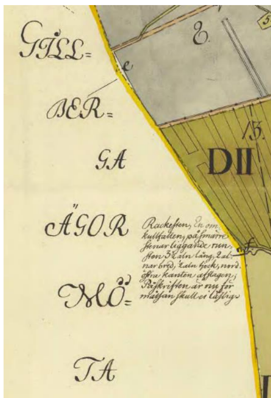
Fig. 120. Ög 104. Gillberga, Kaga sn. Detalj ur Wallbergs karta över Sättuna upprättad 1760, i Lantmäteristyrelsens arkiv.