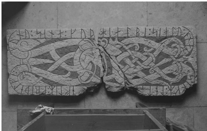
Plansch 63a. Ög 102. Kaga prästgård. Nu i stifts- och landsbiblioteket i Linköping. Foto Nordén 1945. [Vid planschen står: »Frigöres. Hålles ljusare vid tagningen!« Jansson skriver 1947: »Nästan helt retusch«. Se också fotnot 6.]

»Sink lät ... efter Fridälv, sin hustru. Gud hjälpe hennes själ!«