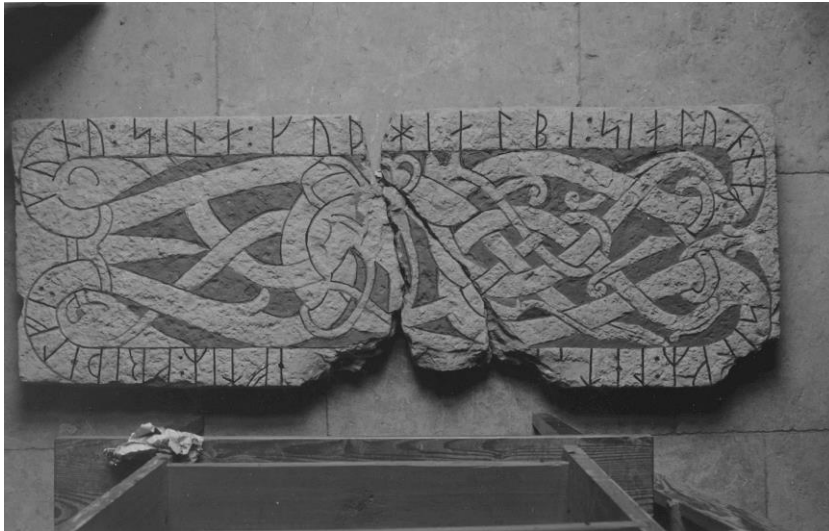
Plansch 63a. Ög 102. Kaga prästgård. Nu i stifts- och landsbiblioteket i Linköping. Foto Nordén 1945. [Vid planschen står: »Frigöres. Hälles ljusare vid tagningen!« Jansson skriver 1947: »Nästan helt retusch«. Se också fotnot 6.]

»Sink lät ... efter Fridälv, sin hustru. Gud hjälpe hennes själ!«