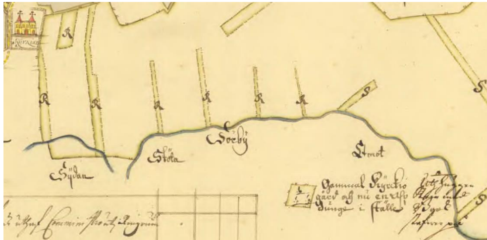
Fig. 108. Ög 100. Ringarums kyrka. Detalj ur Anders Mörns karta över Prästgården, Ringarums sn, upprättad 1700, i Lantmäteristyrelsens arkiv.