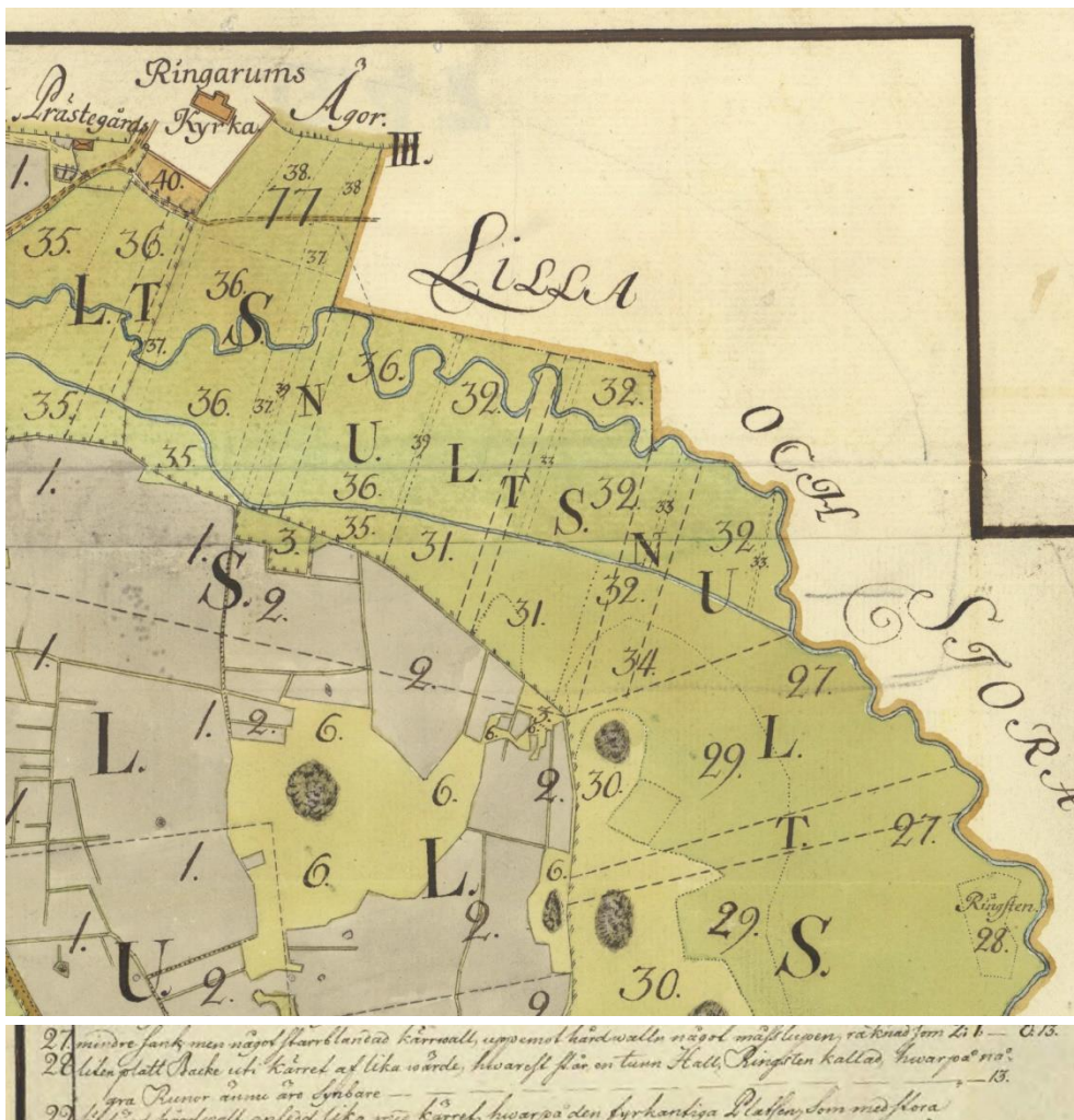
Fig. 109. Ög 100. Ringarums kyrka. Detaljer ur Tihls karta och beskrivning över Sörby upprättad 1769–70, i Lantmäteristyrelsens arkiv.