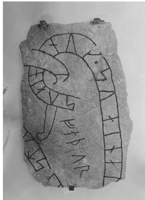
Plansch 59b. Ög 100. Ringarums kyrka. Foto Nordén 1942. [Jansson skriver 1947: Retusch!]