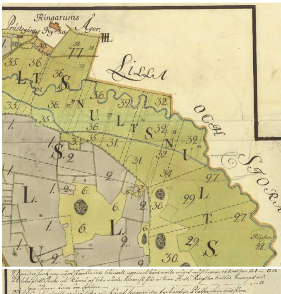
Fig. 109. Ög 100. Ringarums kyrka. Detaljer ur Tihls karta och beskrivning över Sörby upprättad 1769–70, i Lantmäteristyrelsens arkiv.